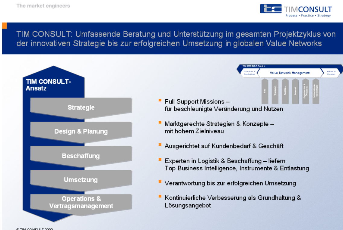
Abbildung 2: TIM CONSULT Beratungsansatz

Suchen Sie einen Sparringspartner um Logistikideen zu entwickeln und zu verwirklichen? Haben Sie konkrete Aufgabenstellungen? Dann laden wir Sie herzlich zu einem persönlichen Gespräch auf die LogiMAT 2010 ein. Gerne stellen wir Ihnen unseren umfassenden Beratungsansatz – Unterstützung von der Strategie über die Beschaffung bis zur erfolgreichen Umsetzung und Nachkontrolle – vor.